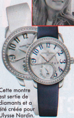
Cette montre est sertie de diamants et a été créée pour Ulysse Nardin.